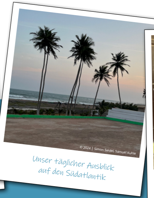
Unser täglicher Ausblick auf den Südatlantik