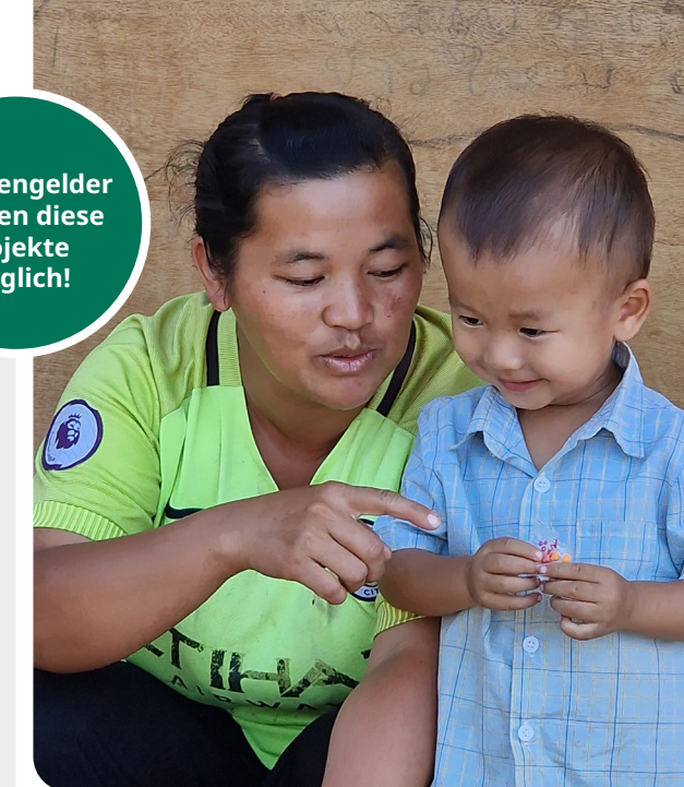
Das Projekt wird durch das ADRA-Netzwerk gefördert.

die Schulkosten finanziert, um sie von der Zwangsarbeit fernzuhalten. Gefährdete Jugendliche sind an einem sicheren Zufluchtsort untergebracht. Dort können sie eine Schule besuchen und erhalten psychologische Hilfe. Schulungen informieren Familien und Behörden über die Gefahr von Menschenhandel.