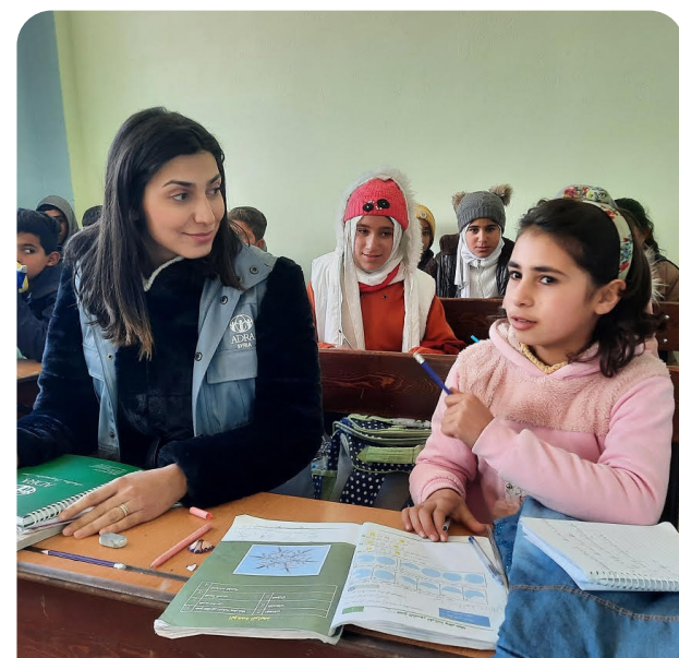
Das Projekt wird von Aktion Deutschland Hilft gefördert.