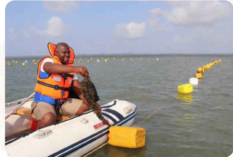
Das Projekt wird durch den Blue Action Fund gefördert.