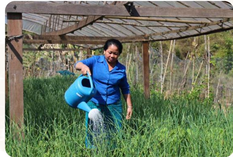
Das Projekt wird durch das BMZ gefördert.