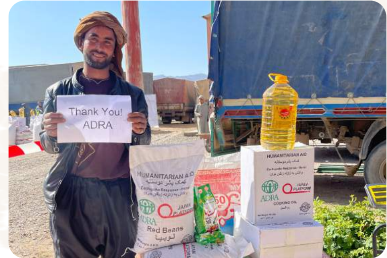
Das Projekt wird durch das ADRA-Netzwerk gefördert.