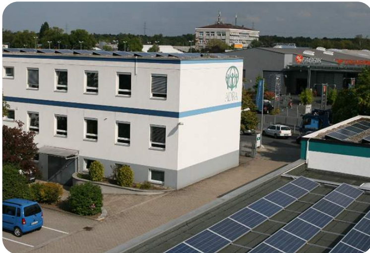
Das Projekt wird durch das ADRA-Netzwerk gefördert.