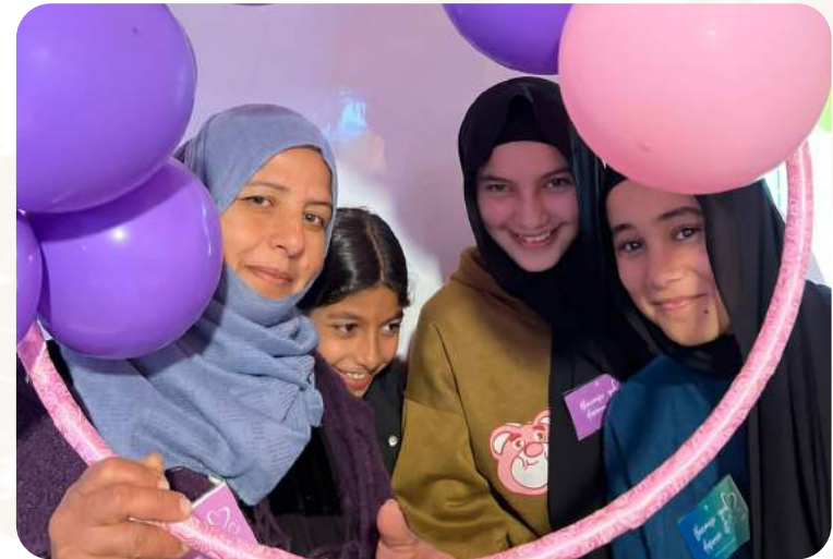
Das Projekt wird durch Aktion Deutschland Hilft gefördert.

Frauen u. a. Damenbinden, Unterwäsche und Seife. Im Rahmen von Sensibilisierungskampagnen werden Frauen und Mädchen über den Umgang mit ihrer Periode aufgeklärt. Schließlich erhalten sie einen finanziellen Zuschuss und Beratung, um ein Kleinunternehmen zu gründen und zu führen. Dadurch können sie eigenständig Geld verdienen.