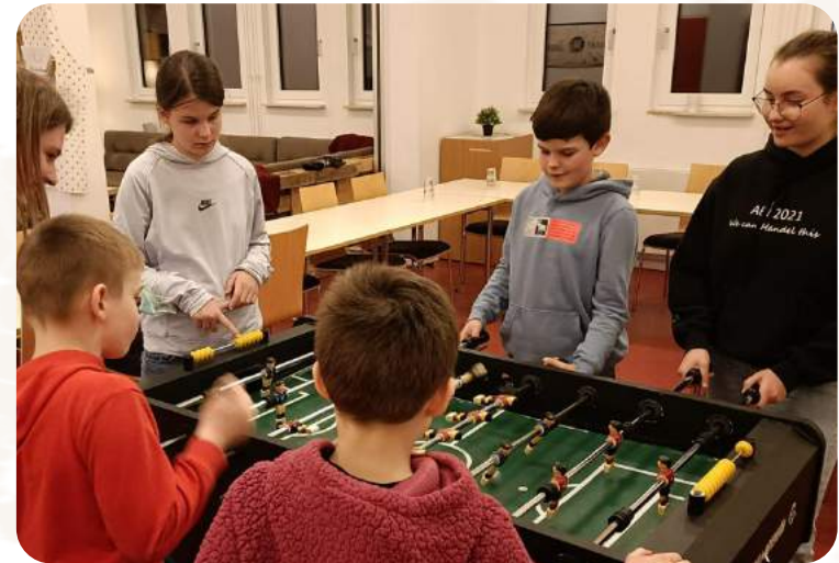
Das Projekt wird durch Aktion Deutschland Hilfe gefördert.

ziale Unterstützung bis hin zu Kochabenden und Freizeitaktivitäten für Kinder und Jugendliche. Bisher kam die Hilfe knapp 5.000 Menschen zugute. Seit Kriegsbeginn organisierte ADRA mehr als 1.200 Unterbringungsmöglichkeiten für Familien aus der Ukraine.