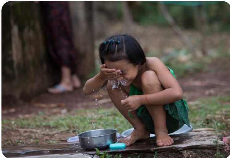
Das Projekt wird durch die Europäische Union und Aktion Deutschland Hilft gefördert.