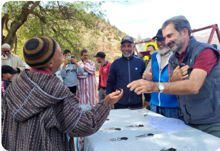
Das Projekt wird durch das ADRA-Netzwerk und Aktion Deutschland Hilft gefördert.