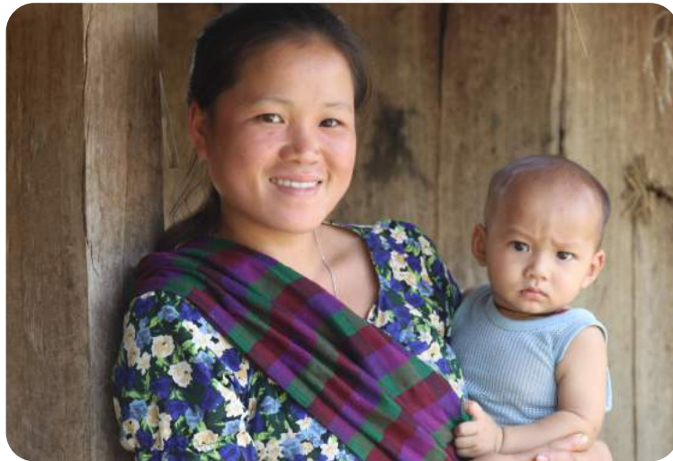
Das Projekt wird durch das BMZ gefördert.