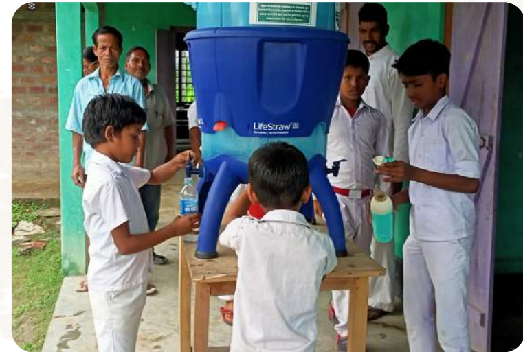
Das Projekt wird durch Aktion Deutschland Hilft gefördert.