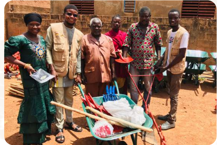
Das Projekt wird durch das BMZ gefördert.

Familien dabei, mehr zu ernten und ein besseres Einkommen zu erzielen. Sie erhalten dürreresistentes Saatgut und lernen neue Anbaumethoden sowie optimierte Tierhaltungspraktiken kennen. Wir helfen ihnen dabei, Kontakte zu lokalen Händlern zu knüpfen, um ihre Überschüsse zu verkaufen.