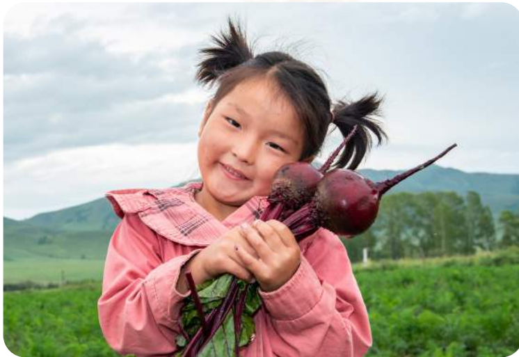
Das Projekt wird durch das BMZ gefördert.