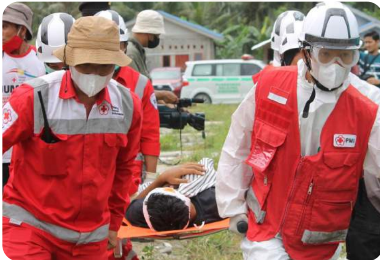
Das Projekt wird durch Aktion Deutschland Hilft gefördert.