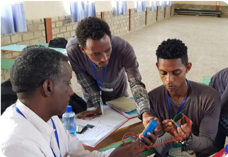
Das Projekt wird durch das BMZ gefördert.