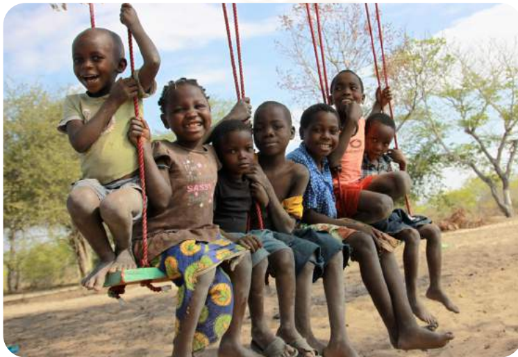
Das Projekt wird durch das BMZ gefördert.