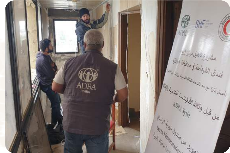
Das Projekt wird durch Aktion Deutschland Hilft gefördert.