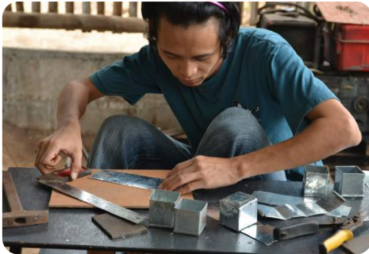
Das Projekt wird durch die Europäische Union und Aktion Deutschland Hilft gefördert.