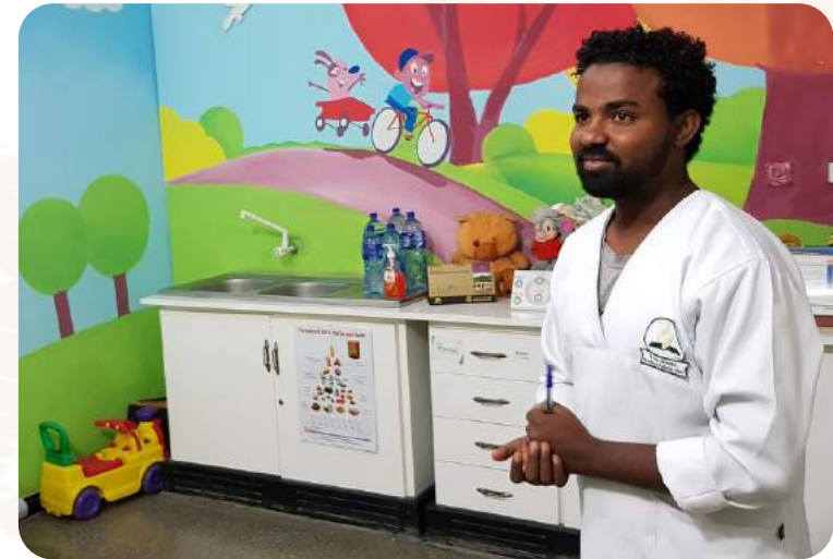
Das Projekt wird durch das ADRA-Netzwerk gefördert.

ung mussten dringend erneuert werden. Mit neuen medizinischen Geräten und der Renovierung der Klinikräume kann die Gesundheitsversorgung dank der Unterstützung der Spenderschaft wesentlich verbessert werden. Die Kinder erhalten eine bessere Behandlung.