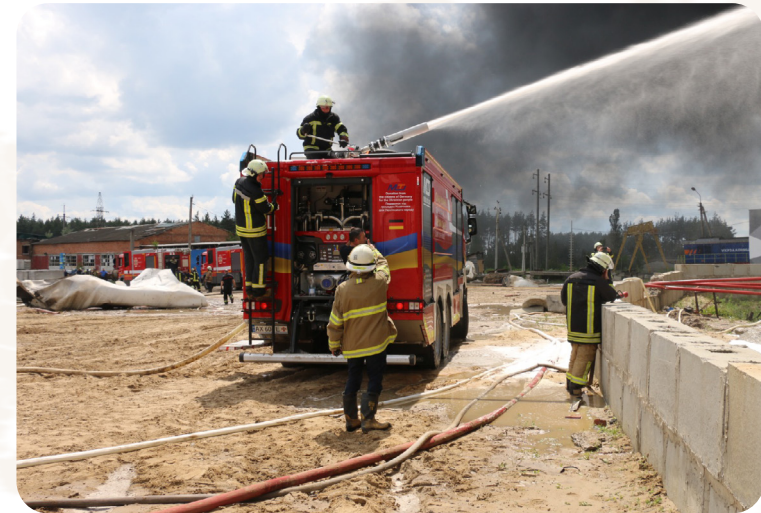
Das Projekt wird durch Aktion Deutschland Hilft gefördert.

nalen Feuerwehreinheiten in Kiew und Charkiw in der Lage, Brände an Tankstellen, Treibstofflagern oder Chemieunternehmen zu löschen. Im Rahmen dieses Projekts wird der Stadt Kiew ein weiteres Feuerwehrauto übergeben, um den ständigen Angriffen besser begegnen zu können. Das Personal wird in der Nutzung des Fahrzeugs geschult.