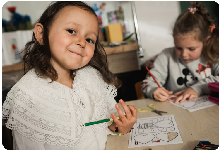
Das Projekt wird durch das ADRA-Netzwerk und Aktion Deutschland Hilft gefördert.