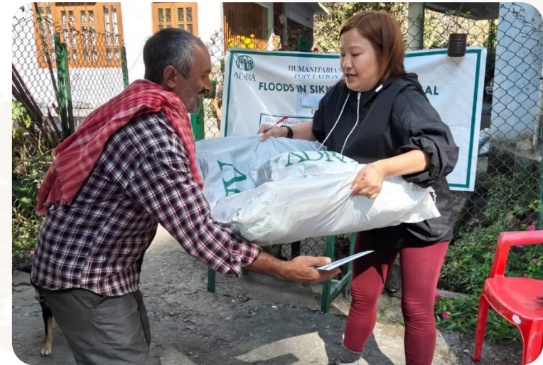
Das Projekt wird durch das ADRA-Netzwerk gefördert.

tastrophe betroffen. ADRA zahlt Geld aus, damit die Menschen eigenständig ihre Bedürfnisse decken und den lokalen Markt unterstützen können. In abgelegenen Gebieten werden Zelte und wichtige Hilfsgüter wie Kochutensilien, Decken und Moskitonetze verteilt. Das Projekt kommt 7.828 Menschen zugute.