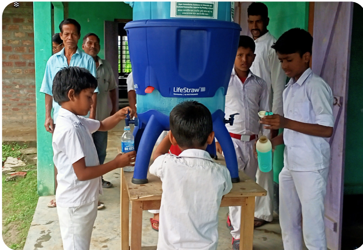
Das Projekt wird durch Aktion Deutschland Hilft gefördert.