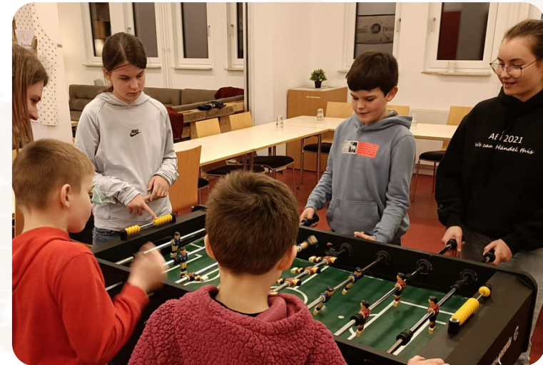
Das Projekt wird durch Aktion Deutschland Hilfe gefördert.

ziale Unterstützung bis hin zu Kochabenden und Freizeitaktivitäten für Kinder und Jugendliche. Bisher kam die Hilfe knapp 5.000 Menschen zugute. Seit Kriegsbeginn organisierte ADRA mehr als 1.200 Unterstützungsmöglichkeiten für Familien aus der Ukraine.