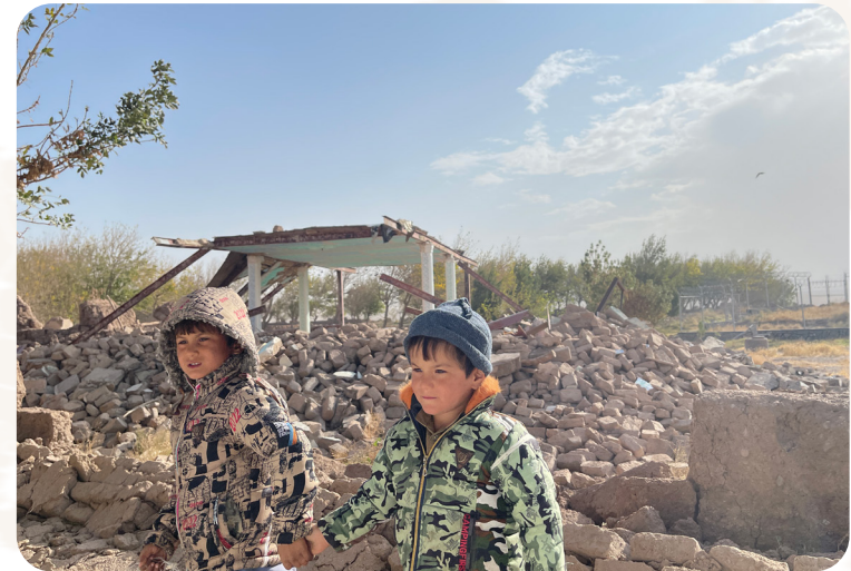
Das Projekt wird durch das ADRA-Netzwerk gefördert.