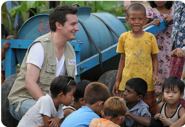
Das Projekt wird durch die Europäische Union und das ADRA-Netzwerk gefördert.