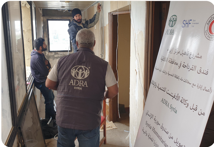
Das Projekt wird durch Aktion Deutschland Hilft gefördert.