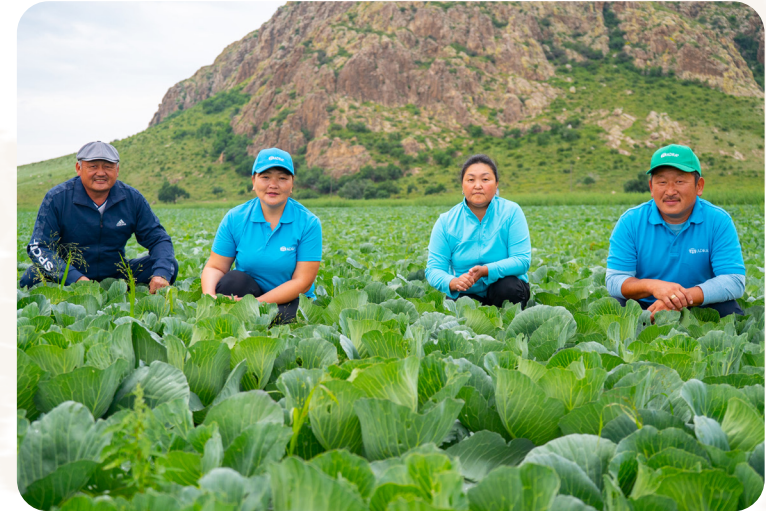
Das Projekt wird durch das BMZ gefördert.