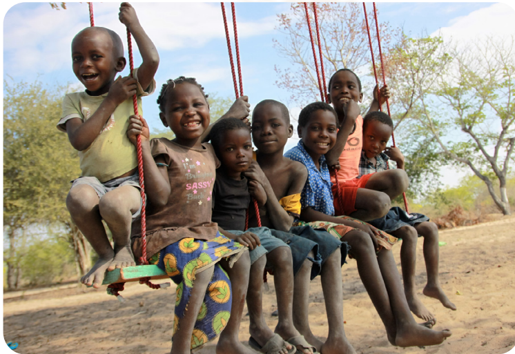
Das Projekt wird durch das BMZ gefördert.