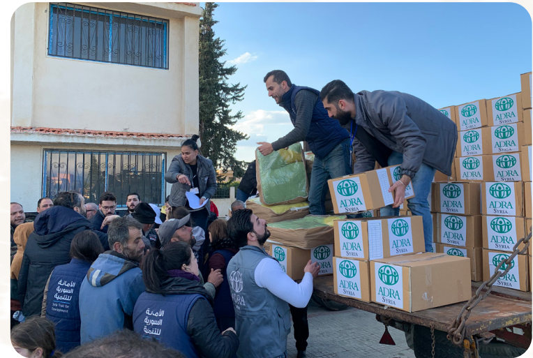
Das Projekt wird durch das ADRA-Netzwerk gefördert.

terial zur Verbesserung der Hygiene bereit. Bedingungslose Soforthilfe wird bereitgestellt, damit die Menschen ihre beschädigten Häuser instand setzen können. ADRA arbeitet außerdem mit den lokalen Behörden zusammen, um die Wassernetze instand zu setzen. Das Projekt kommt 51.060 Menschen zugute.