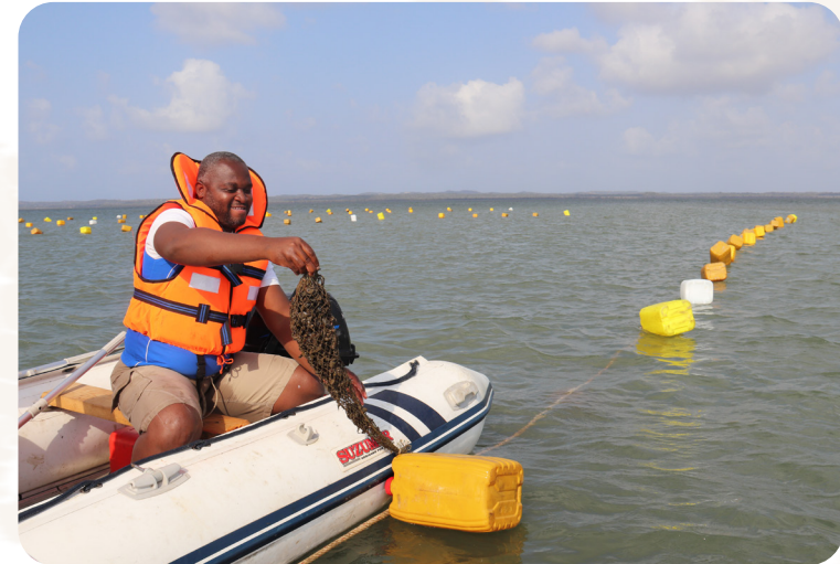
Das Projekt wird durch den Blue Action Fund gefördert.