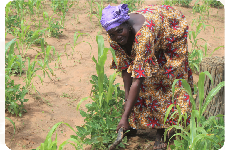
Das Projekt wird durch das BMZ gefördert.