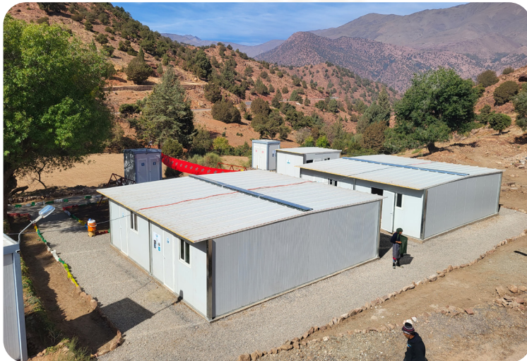
Das Projekt wird durch das ADRA-Netzwerk und Aktion Deutschland Hilft gefördert.