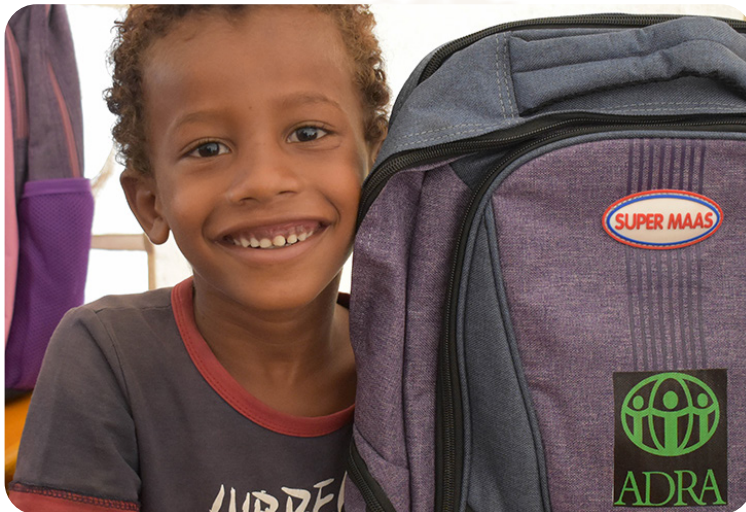
Das Projekt wird durch das BMZ gefördert.