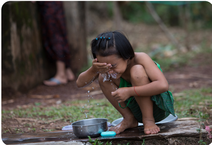
Das Projekt wird durch die Europäische Union und Aktion Deutschland Hilft gefördert.