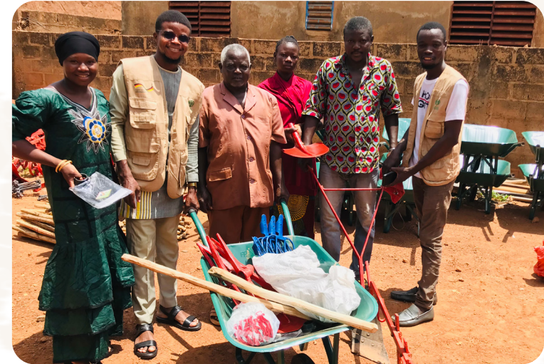
Das Projekt wird durch das BMZ gefördert.

Familien dabei, mehr zu ernten und ein besseres Einkommen zu erzielen. Sie erhalten dürreresistentes Saatgut und lernen neue Anbaumethoden sowie optimierte Tierhaltungspraktiken kennen. Wir helfen ihnen dabei, Kontakte zu lokalen Händlern zu knüpfen, um ihre Überschüsse zu verkaufen.