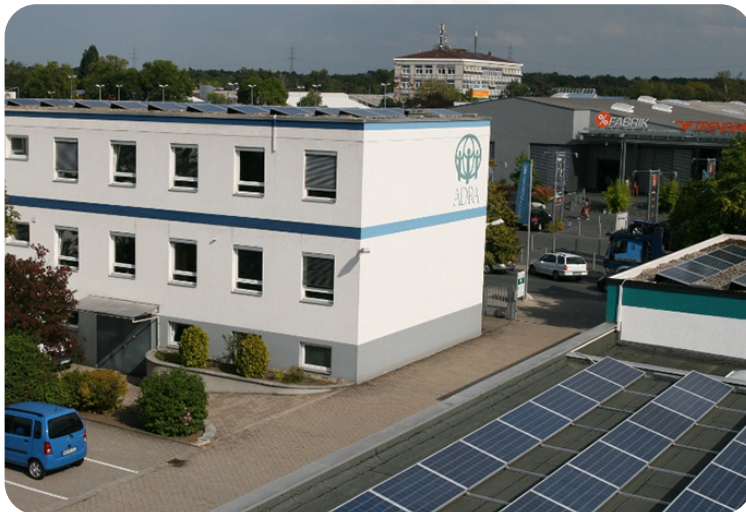
Das Projekt wird durch das ADRA-Netzwerk gefördert.