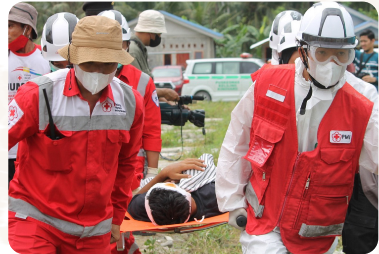
Das Projekt wird durch Aktion Deutschland Hilft gefördert.

den nach neuen Möglichkeiten, die Kosten der Nothilfe im Falle einer Katastrophe einzuschätzen. Für die ersten Hilfsmaßnahmen gibt es ein Budget, um auf akute Bedürfnisse schnell reagieren zu können. Dadurch erhalten 15.000 Menschen im Notfall effektive Hilfe.