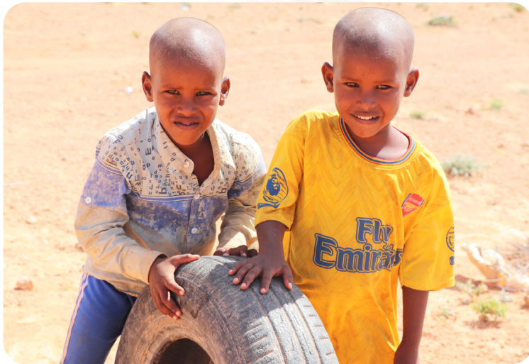
Das Projekt wird durch das ADRA-Netzwerk und Aktion Deutschland Hilft gefördert.